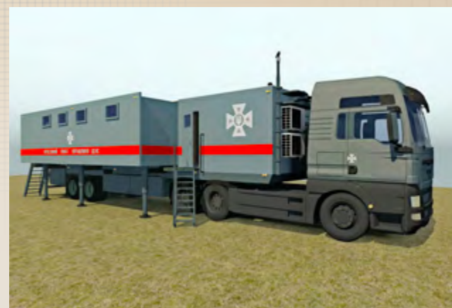
Пересувний пункт управління ДСНС