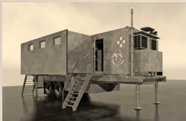
Мобільні пункти управління