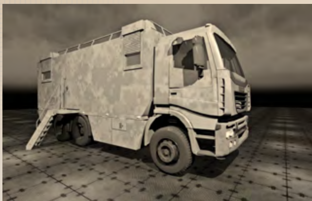
Полевий пункт управління керівного складу